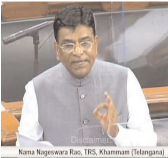
Nama Nageswara Rao, TRS, Khammam (Telangana)

ఖమ్మం, మార్చి 29 (మనం బ్యూరో) : కేంద్ర ప్రభుత్వం తెలంగాణను అడ్డంగా మోసం చేసింది. కాజీపేట రైల్వే కోచ్ ఫ్యాక్టరీ ఏర్పాటు విషయాన్ని అటకెక్కించి, దగా చేసింది. తెలంగాణకు రైల్వే కోచ్ ఫ్యాక్టరీ ఇవ్వమని కేంద్రం మళ్ళీ బుధవారం స్పష్టం చేయడం పట్ల బీఆర్ఎస్ లోక్ సభా పక్ష నాయకులు నామ నాగేశ్వరరావు తీవ్రస్థాయిలో మండిపడ్డారు. కేంద్రం పునర్విభజన చట్టాన్ని సైతం తుంగలో తొక్కి చెప్పిన మాటే పదే పదే చెప్పి తొండి మాటలు చెబుతుండడం పట్ల అసంతృప్తి వ్యక్తం చేశారు. తెలంగాణలో రైల్వే కోచ్ ఫ్యాక్టరీ ఏర్పాటుకు సంబంధించిన ప్రతిపాదనెది కేంద్ర ప్రభుత్వ పరిశీలనలో లేదని కేంద్ర రైల్వే శాఖా మంత్రి అశ్వినీ వైష్ణవ్ సమాధానం చెప్పడం పట్ల నామ నాగేశ్వరరావు తీవ్ర అభ్యంతరం వ్యక్తం చేశారు. బుధవారం ఎంపీ నామ ఈ విషయమై లోక్ సభలో కేంద్ర ప్రభుత్వాన్ని ప్రశ్నించగా, కేంద్రం లిఖితపూర్వకంగా సమాధానం ఇచ్చింది. తెలంగాణలో రైల్వే కోచ్ ఫ్యాక్టరీ ఏర్పాటుకు సంబంధించి ఎలాంటి ప్రతిపాదన లేదని కేంద్ర రైల్వే శాఖా మంత్రి అశ్వినీ వైష్ణవ్ ఖరా ఖండిగా తేల్చి చెప్పడం ఏమిటని నామ ప్రశ్నించారు. కేంద్ర మంత్రి ఇచ్చిన సమాధానంలో విభజన హామీ ప్రస్తావనే లేదన్నారు. ఈ విషయమై పదే పదే పార్లమెంట్లో కేంద్రాన్ని ఎన్నిసార్లు నిలదీసినా నిసిగ్గుగా చెప్పిన సమాధానమే మళ్ళీ మళ్ళీ చెబుతూ వస్తున్నారని పేర్కొన్నారు. సీఎం కేసీఆర్, మంత్రి కేటీఆర్ కేంద్రంపై పలు రకాలుగా ఒత్తిడి తీసుకొచ్చారని అన్నారు. ఆంధ్రప్రదేశ్ పునర్వ్యవస్థీకరణ చట్టం - 2014 అనుసరించి, తెలంగాణకు కేంద్ర ప్రభుత్వం ఖాజీపేటలో కోచ్ ఫ్యాక్టరీ ఏర్పాటు చేస్తానని హామీ ఇచ్చినేడు మాట మార్చడం పట్ల నామ