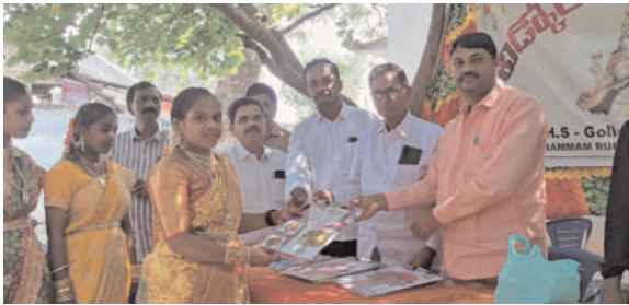
మరియు సిబ్బంది తదితరులు పాల్గొన్నారు.