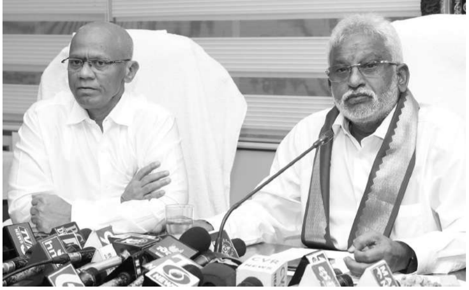
తెలియజేసారు. ఆ వివరాలు ఇలా ఉన్నాయి. ఏప్రిల్ 15 నుండి జూలై 15వ తేదీ వరకు భక్తుల రద్దీ ఎక్కువగా ఉంటుంది కావున సామాన్య భక్తులకు అధిక ప్రాధాన్యత కల్పిస్తూ వివిధ బ్రేక్, శ్రీవారి, టూరిజం కోటా, వర్చువల్ సేవలు, రూ.300/ఋణ దర్శనం కల్పించడానికి అవకాశం కలుగుతుంది.