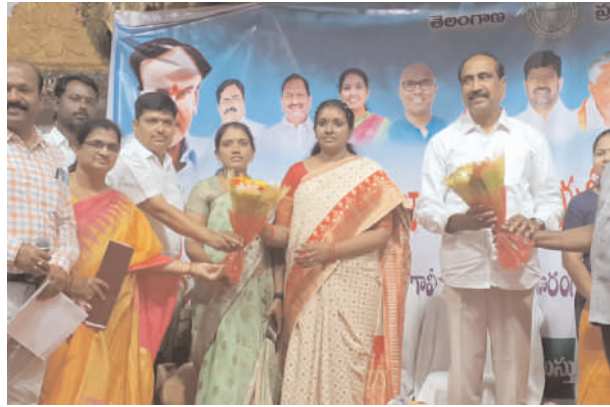
అన్నారని దానికి అనుగుణంగా బాపూజీ ఆశయాల మేరకు సిఎం కేసీఆర్ తెలంగాణ రాష్ట్రం లో గ్రామాలను అభివృద్ధి పరుస్తున్నారన్నారు.