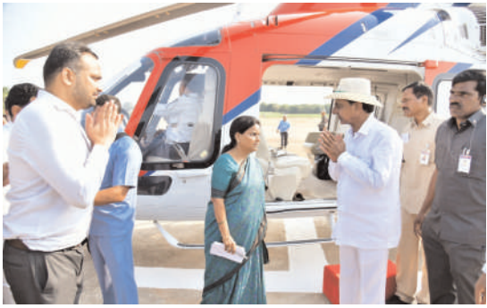
మొదటి పేజీ తరువాయి..

చేయడం తప్ప, అన్నదాతల సంక్షేమంపై చిత్తశుద్ధి లేదని విమర్శించారు. దేశంలో ఇన్నూవేషన్ కంపెనీలకు లాభం కలిగించే బీమాల్లో ఉన్నాయి తప్ప, రైతులకు అండగా నిలిచే బీమాలు, కేంద్ర ప్రభుత్వ పాలసీలు లేవన్నారు. భారతదేశంలో కొత్తగా వ్యవసాయ పాలసీ రావాల్సిన అవశ్యకత ఉందన్నారు. ఇప్పుడు దేశంలో ఒక డ్రామా నడుస్తోందని, ఇప్పుడున్న కేంద్ర ప్రభుత్వం మరి దుర్మార్గంగా ఉందని విమర్శించారు. కేంద్రంలోని బిజెపి ప్రభుత్వం అనుసరిస్తున్న విధానాల కారణంగానే తాము పంట నష్టంపై వారికి నివేదిక పంపాలనుకోవడం లేదని, రాష్ట్ర రైతులను తామే వంద శాతం కాపాడుకుంటామని వ్యాఖ్యానించారు.