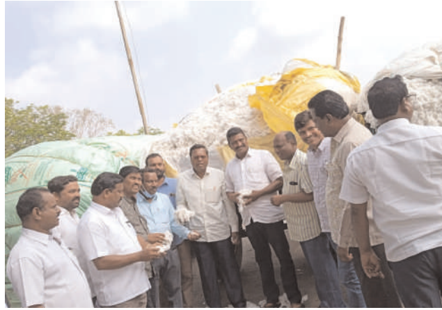
మంగళవారం అమావాస్య, బుధవారం ఉగాది పండుగ సందర్భంగా మార్కెట్ కు సెలవు ప్రకటించినట్లు, తిరిగి గురువారం రోజు మార్కెట్ ప్రారంభం అవుతుందని తెలిపారు.