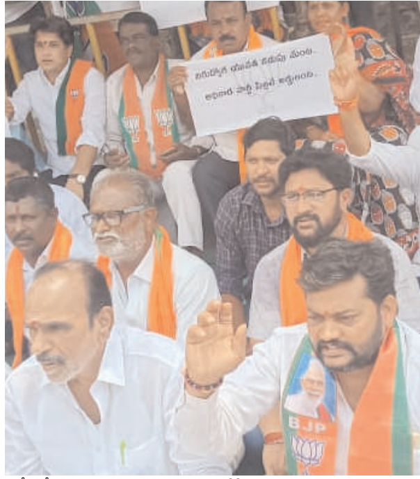
పరీక్షల్లో జరిగిన తప్పుల వల్ల కూడా 30 మంది విద్యార్థులు ఆత్మహత్య