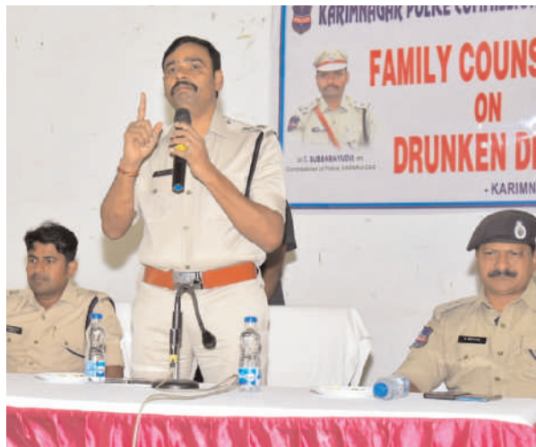
క్రిమినల్ కేసులు నమోదు చేయడంతోపాటు వారి లైసెన్సులను రద్దు చేసేందుకు సిఫారసు చేస్తామని హెచ్చరించారు. పోలీసు కేసులు నమోదైతే ఉద్యోగ, ఉపాధి అవకాశాలు లభించకపోవడమే కాకుండా పాస్ పోర్టులు లభించవని సీపి చెప్పారు. ర్యాష్ డ్రైవింగ్, త్రిబుల్ రైడింగ్, మద్యం సేవించి