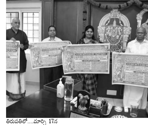
తిరుపతిలో.... మార్చి 17న