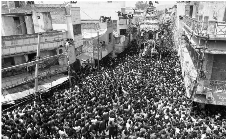
అక్కడ ప్రత్యేక పూజలు మహా మంగళారతి మూర్తి వల్లి, గజల్ రెడ్డివల్లి, తదితర ప్రాంతాల భక్తులు నిర్వహించి రథాన్ని ముందుకు తోడ్చారు. కుటూగుల, తెప్ప వేసి ముద్దులు తొక్కడంతో వేగంగా ముందుకు

కదిరి మార్చి 13వనం న్యూస్: సత్యసాయి జిల్లా కదిరిలో కొలువైన ఖాద్రి లక్ష్మీ నరసింహ స్వామి బ్రహ్మోత్సవానికి భక్తులు పోలిస్తారు. స్వామివారి బ్రహ్మోత్సవం భాగంగా సోమవారం శ్రీవారి బ్రహ్మోత్సవం అత్యంత వైభవంగా నిర్వహించారు. తిరువీడులో భక్తులు స్వామి వారికి దవనం, మిరియాల, కాయ కర్పూరాలు, సమర్పించి మొక్కులు తీర్చుకున్నారు. కదిరి లక్ష్మీనరసింహస్వామి బ్రహ్మోత్సవం సోమవారం భక్తజన సంద్రం నడుమ అంగరంగ వైభవంగా సాగింది. దేవేరులతో కలిసి కాడ్రీశుడు రథంపై తరలివస్తుంటే భక్తులు జయ జయ ధాన్యాలు పలికారు. వేలాదిగా తరలివచ్చిన భక్తులతో కదిరి వీధులు కిక్కిరిసిపోయాయి. రథోత్సవానికి అంద్ర ప్రదేశ్, తమిళనాడు, తదితర ప్రాంతాల నుంచి భక్తులు భారీగా తరలివచ్చారు. ఉదయం ఎనిమిది గంటలకు ఉత్సవం ప్రారంభ సూచికగా రథాన్ని కదిలించారు. 8.25 గంటలకు రథోత్సవం మొదలైంది. తిరువీడులో భక్తులు స్వామివారికి దవనం మిరియాల, కాయ కర్పూరాల సమర్పించి మొక్కులు తీర్చుకున్నారు. 10 గంటలకు చోక్ వద్దకు చేరుకుంది.