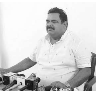
అధికారంలో ఉండటం, అక్రమ మెనింగ్ కార్యకలాపాల ద్వారా కోట్లాది రూపాయల అక్రమ సంపాదన ధనం వీరి ఆదానకాలకు, అదృష్టం లేకుండా పోయిందన్నారు. పేద మధ్యమ తరగతి వర్గాల ప్రజలు అప్పు కష్టాలు

బళ్ళారి, మార్చి13, మనం ప్రతినిధి మాజీమంత్రి, కె ఆర్ పి ఈ పార్టీ వ్యవస్థాపకుడు గాలి జనార్ధన్ రెడ్డి అక్రమాలపై, భూ కుంభకోణాలపై త్వరలో తాను కేంద్ర గృహ మంత్రి, అమిత్ షా ను కలిసి ఫిర్యాదు చేస్తానని, సీట్ మాజీ ఎమ్మెల్యే, కాంగ్రెస్ పార్టీ నాయకుడు, అనిల్ రాడ్ పేర్కొన్నారు. సోమవారం నగరంలోని తమ నివాసంలో విలేజరుల సమావేశంలో మాట్లాడారు. అధికార బలంతో, ధన బలంతో మాజీ మంత్రి గాలి జనార్ధన్ రెడ్డి పలు అక్రమాలకు పాల్పడ్డారని ఆరోపించారు. టీబీ శాంతిరెడ్డి, 150 ఎకరాల భూమిని, అలాగే ఆపంబవి ప్రాంతంలో నదావ్ లకు చెందిన 100 ఎకరాల భూమిని భూమిని బలవంతంగా అక్రమించుకున్నారు న్నారు. రాష్ట్రంలో బీజెపి