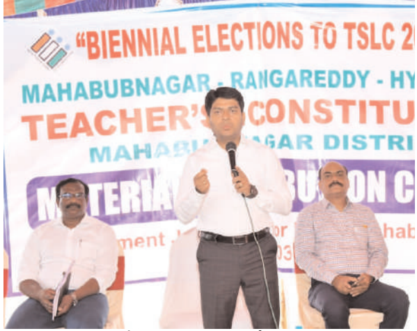
మాట్లాడుతూ జిల్లాలో ఉపాధ్యాయ ఎమ్మెల్సీ ఎన్నికల నిర్వహణకు అవసరమైన అన్ని ఏర్పాట్లు చేశామని, జిల్లాలో 15 పోలింగ్ కేంద్రాలు ఏర్పాటు చేశామని, ఇప్పటి వరకు కేంద్రాల్లోనే ఉన్నాయని, మొత్తం 9461 మంది ఓటర్లు ఓటు హక్కును వినియోగించుకోనున్నారాజీ ఇందులో 1881 మంది పురుషులు, 1580 మంది మహిళా ఓటర్లు వారి ఓటు హక్కును వినియోగించుకోనున్నట్లు తెలిపారు. పోలింగ్ కేంద్రంలో అవసరమైన అన్ని ఏర్పాట్లు చేసినట్లు జిల్లా కలెక్టర్ తెలిపారు. డి.ఎన్.పి మహాద్వి, ఎమ్మెల్సీ ఎన్నికల నోడల్ అధికారులు, ఠానిలూర్, పి.ఓ.పి పి ఓ లు, సిబ్బంది ఉన్నారు.