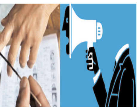
మూడు జిల్లాల పరిధిలో మూతపర్ల వైస్ షాప్స్ హైదరాబాద్, రంగారెడ్డి, మహబూబ్ నగర్ ఉపాధ్యక్షుడు ఎమ్మెల్యే ఎన్నికల ప్రచారం ముగిసింది. ఎన్నిక నేపథ్యంలో మూడు రోజులపాటు మద్యం దుకాణాలు బంద్ అయ్యాయి. 13న ఎమ్మెల్యే ఎన్నికలకు పోలింగ్ జరగనుంది. ఈ క్రమంలో ఆ మూడు ..మిగతా 2లో

రేపు ఎన్నికల నిర్వహణకు కసరత్తు అమరావతి, మార్చి 11 (సునం న్యూస్): ఎపిలో ఉపాధ్యక్షుడు ఎమ్మెల్యే ఎన్నికల ప్రచారం ముగిసింది. శనివారం సాయంత్రం ప్రచారం నీకి తెరపడింది. 2 ఉపాధ్యక్షులు ఎమ్మెల్యే స్థానాలు, 3 పట్టణ ప్రజలకు ఎమ్మెల్యే స్థానాలకు 13న ఎన్నికలు జరుగుతున్నాయి. మార్చి 13న ఎమ్మెల్యే ఎన్నికల పోలింగ్ జరగనుంది. ప్రకాశం నెల్లూరు చిత్తూరు పట్టణ ప్రజలకు ఎమ్మెల్యే స్థానం (తూర్పు రాయలసీమ), కడప అనంత పురం కర్నూరు పట్టణ ప్రజలకు ఎమ్మెల్యే స్థానం (వశీషమ రాయలసీమ), త్రికాళం విజయ నగరం విశాఖ పట్టణ ప్రజలకు ఎమ్మెల్యే స్థానం (ఉత్తర రాంధ్ర), ప్రకాశం నెల్లూరు చిత్తూరు ఉపాధ్యక్షులు ఎమ్మెల్యే స్థానం, కడప అనంతపురం కర్నూరు ఉపాధ్యక్షులు ఎమ్మెల్యే స్థానం ఎన్నికలు జరగ నున్నాయి. ఈ ఎన్నికలకు ప్రచార గడువు ముగియడంతో ఎన్నికల నిర్వహణకు అధికారులు ఏర్పాటు చేశారు. ముగిసిన ఎమ్మెల్యే ఎన్నిక ప్రచారం