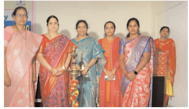
ంకాకతీయ స్టార్ట్ కిడ్స్ పాఠశాలలో.. ఘనంగా మహిళా దినోత్సవ వేడుకలు