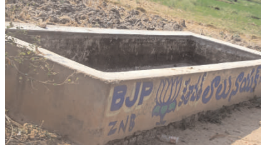
ఏర్పాటు చేసిన పశువుల దాహార్తి తీర్చాలని రైతులు కోరుతున్నారు.

చింతపల్లి మార్చి 1(మనం న్యూస్): పశువుల దాహార్తి కోసం గ్రామాల్లో జాతీయ ఉపాధి హామీ పథకం ద్వారా లక్షలు ఖర్చు చేసి నీటితొట్లను ఏర్పాటు చేశారు. వాటి నిర్వహణ సక్రమంగా లేకపోవడంతో ప్రస్తుతం గ్రామాల్లో ఎక్కడ చూసిన నీటితొట్ల నీరు లేక కేవలం అలంకార ప్రాయంగా దర్శనమిస్తున్నాయి. చింతపల్లి మండలంలోని 34 గ్రామపంచాయతీల్లో రూ. 15 లక్షలు అంచన వ్యయంతో ప్రభుత్వం పశువుల దాహం కోసం నీటితొట్లను ఏర్పాటు చేసింది. గ్రామపంచాయతీ, మండల స్థాయి అధికారులు క్షేత్రస్థాయిలో దృష్టిసారించకపోవడంతో కేవలం ఉత్సవ విగ్రహంలాగా మారాయి. పశువులు నీటి కోసం అల్లాడుతున్నాయి. అధికారులు స్పందించి నీటితొట్లో నీరు