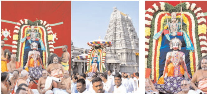
గరుడ వాహన దారుడై