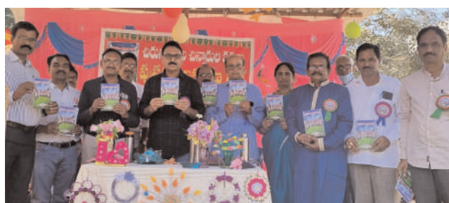
చిరునోముల హైస్కూల్లో విద్యార్థుల కథల పుస్తకాన్ని ఆవిష్కరిస్తున్న దృశ్యం