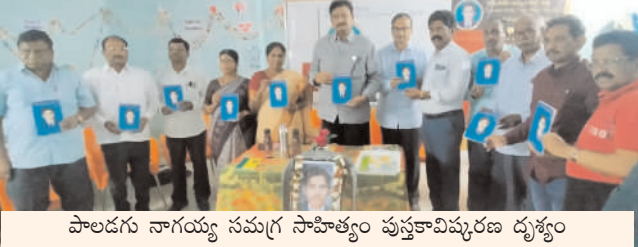
పాలడగు నాగయ్య సమగ్ర సాహిత్యం పుస్తకావిష్కరణ దృశ్యం