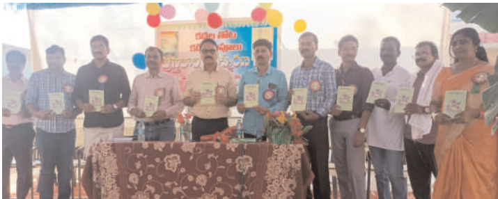
ఇల్లేపల్లి హైస్కూల్లో బాలల కథల, కవితల పుస్తకాన్ని ఆవిష్కరిస్తున్న దృశ్యం

సాయంత్రం 5 గంటల దాకా పుస్తకాల ఆవిష్కరణ సభ జరగడం విశేషం.