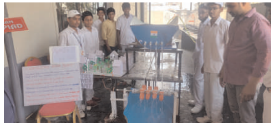
వననరులకు ప్రత్యామ్నాయంగా రూపొందించిన సమూహాలతోపాటు విద్యార్థులు తయారు చేసిన ప్రదర్శనలను వారు తిలకించారు. ఈ