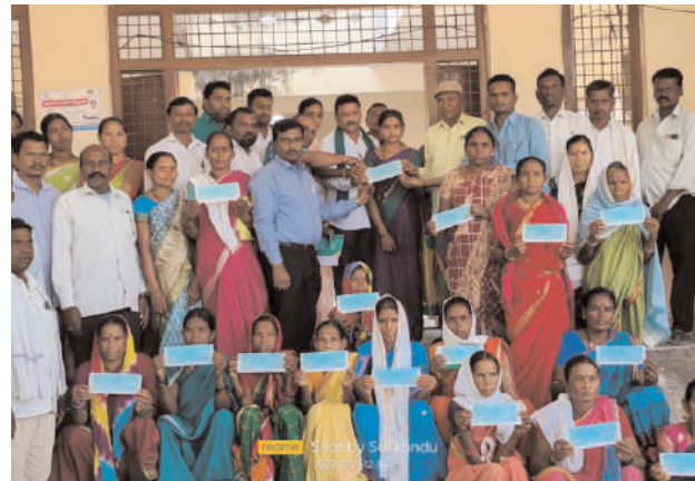
ప్రజాప్రతినిధులు, బిఆర్ఎస్ నాయకులు తదితరులు పాల్గొన్నారు.