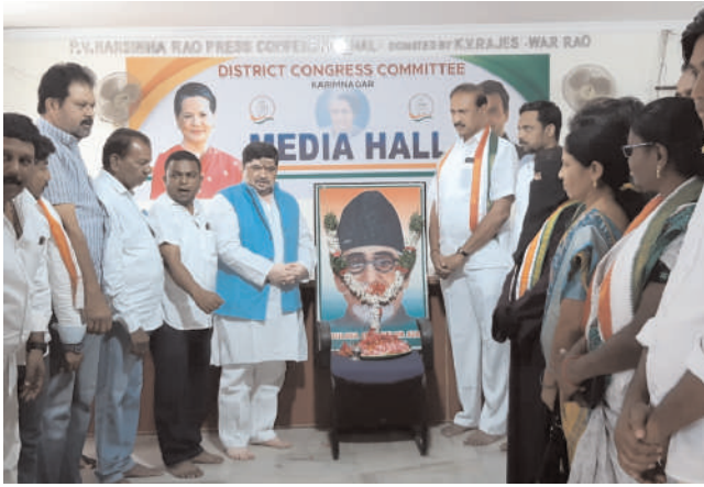
కరీంనగర్, ఫిబ్రవరి 22 (మనం న్యూస్): మౌలానా అబుల్ కలాం ఆజాద్ 85వ వర్ధంతి కార్యక్రమాన్ని జిల్లా కాంగ్రెస్ కార్యాలయంలో నగర మైనార్టీ సెల్

షీటీమ్ ఆధ్వర్యంలో విద్యార్థినులకు అవగాహన సదస్సు