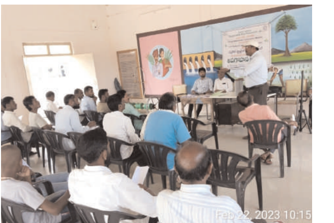
జమ్మికుంట రూరల్, ఫిబ్రవరి 22 (మనం న్యూస్): తడి పొడి పద్ధతిలో వరి