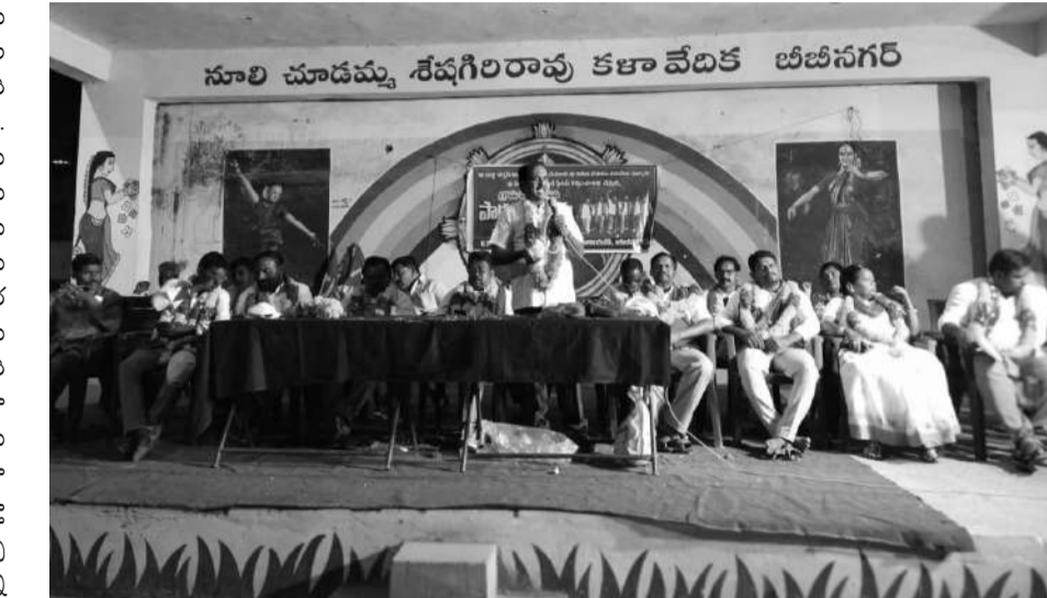
కాలం పనిచేసిన కనీస వేతనం లేదని, ఫిచన్, పిఎఫ్, ఇవినెజ సౌకర్యం లేదని ప్రభుత్వం స్పందించి గ్రామ పంచాయతీ కార్మికుల సమస్యలు పరిష్కారించాలని లేని యెడల సిబిఐఎం అధ్యక్షులతో గ్రామ పంచాయతీ కార్మికుల ఉద్యమాన్ని ఉద్యతం చేస్తామని హెచ్చరించారు.