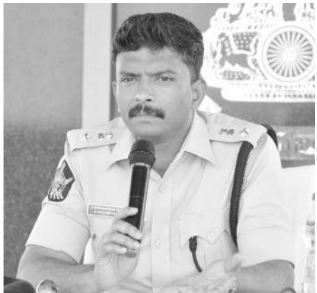
మైదానంలో బుద్ధవారం నిర్వహించిన ముగింపు కార్యక్రమంలో జిల్లా ఎస్పీ గారు ముఖ్య అతిథిగా