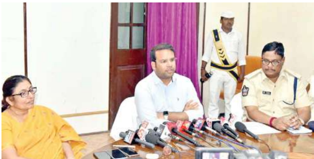
అనంతపురము. ఫిబ్రవరి 17 మనం న్యూస్ ప్రతినిధి.

జిల్లాలో ఎమ్మెల్యే ఎన్నికల కోడ్ అమలు కోసం కట్టుదిట్టమైన ఏర్పాట్లు చేస్తున్నామని ఇంచార్జ్ జిల్లా కలెక్టర్ కేతన్ గార్డ్ పేర్కొన్నారు. శుక్రవారం సాయంత్రం స్థానిక కలెక్టరేట్ లోని మినీ కాన్ఫరెన్స్ హాలులో ఎమ్మెల్యే ఎన్నికల నిర్వహణపై ఇంచార్జ్ జిల్లా కలెక్టర్ కేతన్ గార్డ్ విలేకర్ల సమావేశం నిర్వహించారు. సమావేశంలో ఆయన మాట్లాడుతూ ఈనెల 09న ఎన్నికల షెడ్యూల్ విడుదల అయ్యిందన్నారు. అప్పటి నుంచి ఎన్నికల కోడ్ అమలులో ఉండన్నారు. జిల్లా వ్యాప్తంగా ఎన్నికల కోడ్ అమలును పర్యవేక్షించేందుకు ప్రత్యేకంగా టీమ్ లు ఏర్పాటు చేశామన్నారు. ఎంపీడీవోల నేతృత్వంలో మండలానికోక టీమ్ ఏర్పాటు చేశామన్నారు.