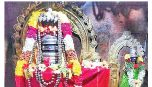
మడకశిర, ఫిబ్రవరి 17, మనం న్యూస్:

మహా శివరాత్రి పర్వదినాన ప్రముఖ శైవ క్షేత్రాలన్నీ శివ నామ స్మరనతో మారుమోగిపోతున్నాయి. శివారాధనలో లింగరూపంలో పూజిస్తారు. ప్రతి లింగంలోనూ శివుని జ్యోతి స్వరూపం వెలుగుతుందని నమ్మకం. వీటిలో ద్వాదశ జ్యోతిర్లింగాలు ప్రధానమైనవి. మహాశివరాత్రి పర్వదినాన శివాలయాల్లో భక్తుల రద్దీ కనిపిస్తుంది. అభిషేకాలు , పూజలతో పరమశివుని ఆరాధిస్తారు. దేశంలోని ద్వాదశ జ్యోతిర్లింగాలలో ఈ విశిష్ట దినాన రోజంతా ప్రత్యేక పూజలు జరుపుతారు. రాత్రి కూడా దేవాలయాలు తెరిచే ఉంటాయి. పూజలు, భజనలతో శివనామం మారుమోగు తుంటుంది. ఈ పర్వదినాన లింగాష్టకం, శివ పంచాక్షరి జపిస్తారు. దీపారాధన చేసి, భక్తిప్రపత్తులతో రుద్రాభిషేకం చేస్తారు. శివపార్వతుల కల్యాణం చేస్తారు. రోజంతా పరమేశ్వరుని ప్రార్థనలతో , చింతనలో గడిపి , రాత్రి జాగారం చేస్తారు. శివరాత్రి పర్వదినానికి ఉపవాసం, జాగారం ముఖ్యం. అసలు శివరాత్రి విశిష్టత ఏమిటి ? ఆ రోజు ఉపవాసం ఎందుకుంటారు ? జాగారం ఎందుకు చేస్తారు ? జాగారం ఎవరు ఎప్పుడు