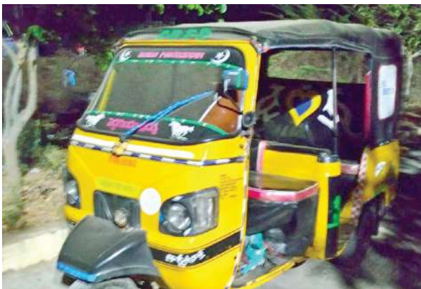
ముదిగుబ్బ ఫిబ్రవరి 16, మనం న్యూస్.

ఓ ఆటో కలకలం రేపింది. అది కూడా ఎక్కడో కాదు రైల్వే స్టేషన్ ఆవరణలో పార్కింగ్ చేయడం వివాదాస్పదమైంది. ఒక రోజు కాదు ఏకంగా వారం రోజులు అంతా ఒకే చోట ఉండిపోవడంతో అనుమానం కలిగింది. ఈ విషయం ప్రయాణీకుల ద్వారా తెలుసుకొని స్టేషన్ మాస్టర్ రైల్వే పోలీసులకు సమాచారం అందించారు. చివరికి పోలీసుల జోక్యంతో కథ సుఖాంతం అయింది. వివరాల మేరకు రైల్వే పోలీసులు రంగంలోకి దిగి ఆటోకు ఉన్న వెహికల్ నెంబర్ ఆధారంగా సంబంధిత రోడ్డు రవాణా అధికారి కార్యాలయంలో అధికారులతో మాట్లాడారు. ఆటో నెంబర్ను కనిపెడుతూ యజమాని పేరు, ఊరు, చిరునామా తదితర వివరాలను సేకరించారు.. అనంతపురం నగరానికి చెందిన జాభర్కు చెందినదిగా గుర్తించారు. సదరు యజమానికి ఉన్న నెంబర్ ఆధారంగా ఫోన్ చేసి ఇక్కడికి పిలిపించి మందలించారు. ఇలా స్టేషన్లో ఇన్ని రోజులుగా రాంగ్ పార్కింగ్ చేసి ఉంచడంపై పలు అనుమానాలకు తావిస్తోందన్నారు. ఇన్ని రోజులుగా ఇక్కడ ఎందుకు ఉంచావు అని చెప్పి కేసు నమోదు చేసి దర్యాప్తు చేపట్టి విచారణ అనంతరం చివరకు ఆ యజమానికి అప్పగించారు. అందరూ ఊపిరి పీల్చున్నారు. దీంతో కథ సుఖాంతమైంది.