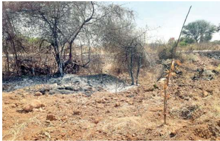
ముదిగుబ్బు ఫిబ్రవరి 16, మనం న్యూస్

ముదిగుబ్బు శివారు ప్రాంతంలోని దొరిగల్లు రోడ్డులోని వీరభద్రస్వామి కట్టకు ఆసుకుని ఉన్న అబిదాబీకి చెందిన మామిడితోట