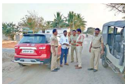
ఓబుల దేవర చెరువు ఫిబ్రవరి17 మనం న్యూస్: