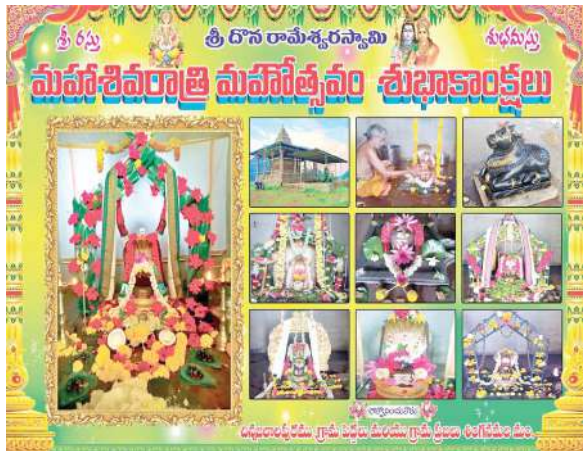
సింగనమల, ఫిబ్రవరి 17, మసం న్యూస్: