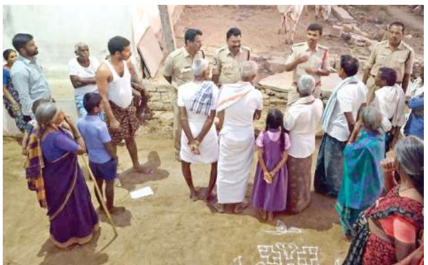
గ్రామాల్లో ప్రజలు ఐకమత్యంగా ఉండాలి : ఎస్ఐ కే గోపినాథ్