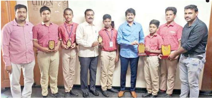
అనంతపురం, ఫిబ్రవరి 17 మనం న్యూస్ :

స్థానిక కమ్యూనిటీ సమీపంలోని శ్రీ చైతన్య సీ అండ్ ఎం డెస్కాలర్ క్యాంపస్ కు చెందిన విద్యార్థులు ఈ నెల 16వ తేదీ కడపలో స్టూడెంట్ ఓలంపిక్ అసోసియేషన్ వారి ఆధ్వర్యంలో నిర్వహించిన స్టేట్ లెవెల్ టోర్నమెంట్ బ్యాడ్మింటన్ అండర్ 17, అండర్ 14 విభాగాలలో తమ పాఠశాల విద్యార్థులు ప్రథమ, ద్వితీయ స్థానంలో నిలిచి విజయ