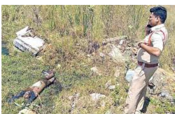
సోమండ్లపల్లి, ఫిబ్రవరి 17 (మనం న్యూస్) :

క్రీతమే హత్య జరిగి ఉండవచ్చని తెలిపారు ఈ హత్య కేసును అన్ని కోణాల్లో దర్యాప్తు చేస్తున్నామని ఎస్పీ తెలిపారు