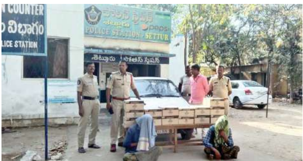
శెట్టూరు, ఫిబ్రవరి 17 (మనం న్యూస్) :