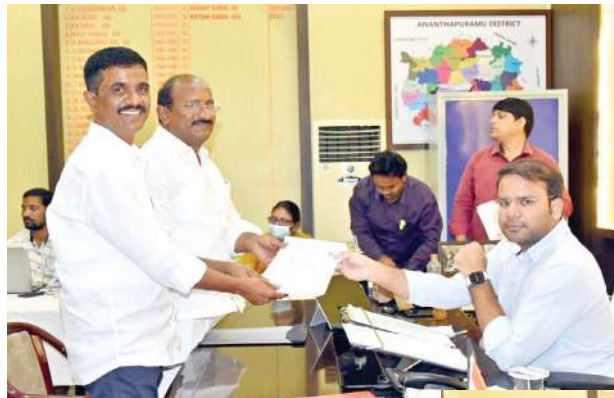
అనంతపురము,ఫిబ్రవరి,17 మనం న్యూస్ ప్రతినిధి :