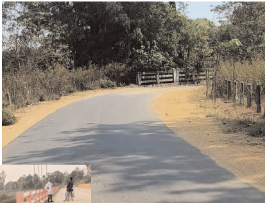
మార్కొడు నుండి బోడయ్యకుంట్ల మార్గంలో కోతలు

ఆళ్లపల్లి, ఫిబ్రవరి 14 (మనం న్యూస్) : కొత్తగూడెం నుండి ఆళ్లపల్లి ప్రధాన రహదారిలో అనేక మూలములు ప్రమాదకరంగా ఉన్నాయని వాటి వద్ద కనీసం హెచ్చరిక బోర్డులు లేక వాహనదారులు అనేక ఇబ్బందులు పడుతు ప్రమాదాలకు గురి అవుతున్నారని మండల ప్రజలు వాహనదారులు ఆవేదన వ్యక్తం చేస్తున్నారు. ఈ మార్గం గుండా నిత్యం ప్రజలు అనేకమంది వాహనాలలో ప్రయాణాలు సాగిస్తున్నారని, ఈ మార్గంలో ప్రమాదకరమైన మూలములు ఉండడం తో వాటివద్ద సరైన ప్రమాదకర హెచ్చరిక బోర్డులు లేకపోవడంతో గమనించక ప్రమాదాలు జరుగుతున్నాయని గతంలో పలుమార్లు వాహనదారులు ప్రమాదాలకు గురై కాళ్లు చేతులు పోగొట్టుకొన్న వారు లేకపోలేదు, మరికొందరు మరణించిన దాఖలు కూడా ఉన్నాయని గ్రామ ప్రజలు ఆవేదన వ్యక్తం చేస్తున్నారు. గ్రామాలకు దిక్కుబి బోర్డు సరిగా లేక రాత్రివేళ కొత్తగా వచ్చే వాహనదారులు గ్రామాల పేర్లు తెలియక ఇబ్బందులు పడుతున్నారని ఇప్పటికైనా సంబంధిత అధికారులు చొరవ చూపి సదురు గ్రామాలు, మూలముల వద్ద ప్రమాదాలు జరగకుండా ప్రమాద హెచ్చరిక బోర్డులు, గ్రామాల సూచిక బోర్డులు ఏర్పాటు చేసి తగు జాగ్రత్తలు తీసుకోవాలని మండల ప్రజలు వాహనదారులు కోరుకుంటున్నారు.