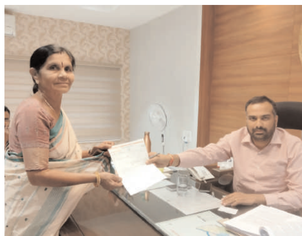
రహదారి మురికి కాలవ నిర్మాణ పనులు చేయడానికి తక్షణం చర్యలు చేపట్టాలని, పూర్తిగా ఇక్కడి అభివృద్ధి పనులను స్మార్ట్ సిటీ పనుల కింద చేపట్టాలని ఆమె కోరారు.