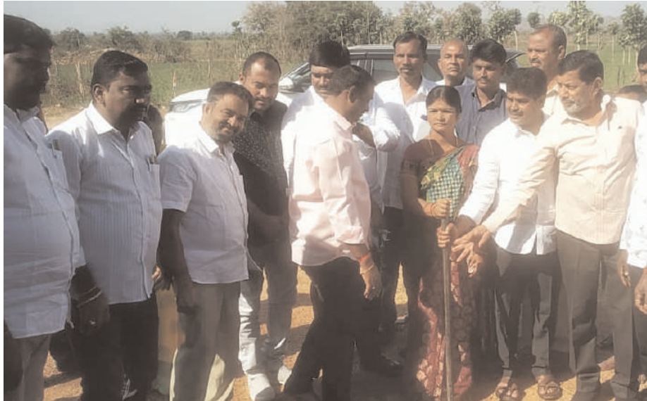
పట్టణాల్లో అసమానతలను తొలగించే ప్రయత్నంలో అభివృద్ధికి పెద్ద పీట వేస్తున్నారన్నారు. రాష్ట్రంలో అనేక అందరి జీవన ప్రమాణాలు పెంచడానికి గ్రామీణ ప్రజా సంక్షేమ పథకాలను ప్రవేశపెట్టి అమలు చేస్తున్న