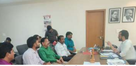
జరిగింది. ఈ సమావేశంలో మున్సిపల్ కమీషనర్లు, ఇన్స్పెక్టర్-మెంటల్ ఇంజనీర్లు, కంప్యూటర్ ఆపరేటర్లు, ఎన్వై ప్రతినిధులు పాల్గొన్నారు.

భువనగిరి, జనవరి 18(మనం న్యూస్): స్వచ్ఛ సర్వేక్షన్ 2023పై జిల్లాలోని ఆరుగురు మున్సిపల్ కమీషనర్లతో జిల్లా అదనపు కలెక్టర్ లోకల్ బాడీ సమావేశం బుధవారం ఏర్పాటు చేయడం జరిగింది. ఈ సమావేశంలో ఆయన మాట్లాడుతూ ఓడివెస్ సర్టిఫికేట్ పొందుటకు, సిటి/పిటి నిర్వహణ, ఎఫ్ఎస్ఐటి నిర్వహణ మరియు టాయిలెట్ల యందు మరమ్మత్తులు ఉన్నట్లయితే వెంటనే చేయటకు మరియు ఎప్పటికప్పుడు పరిశుభ్రంగా ఉంచుటకు తగిన సూచనలు ఇవ్వడం జరిగింది. జిఎఫ్సి(గార్బిజ్ ఫ్రీ సిటీ) కొరకు ప్రతిరోజూ ఇంటింటి చెత్త సేకరణ, హోంకంపోస్టు, తడిచెత్త, పొడిచెత్త సేకరణ, మరియు సిడి వేస్ట్ సేకరణ, విల్డో కంపోస్టు, డిలెటెన్సి నిర్వహణ, విషయంలో తగిన సూచనలు, సలహాలు ఇవ్వడం