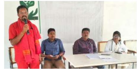
ప్రసాంతి, సర్పంచ్లు, ఎంపిటిసీలు, కార్యదర్శులు, ఆరోగ్య సిబ్బంది తదితరులు పాల్గొన్నారు.